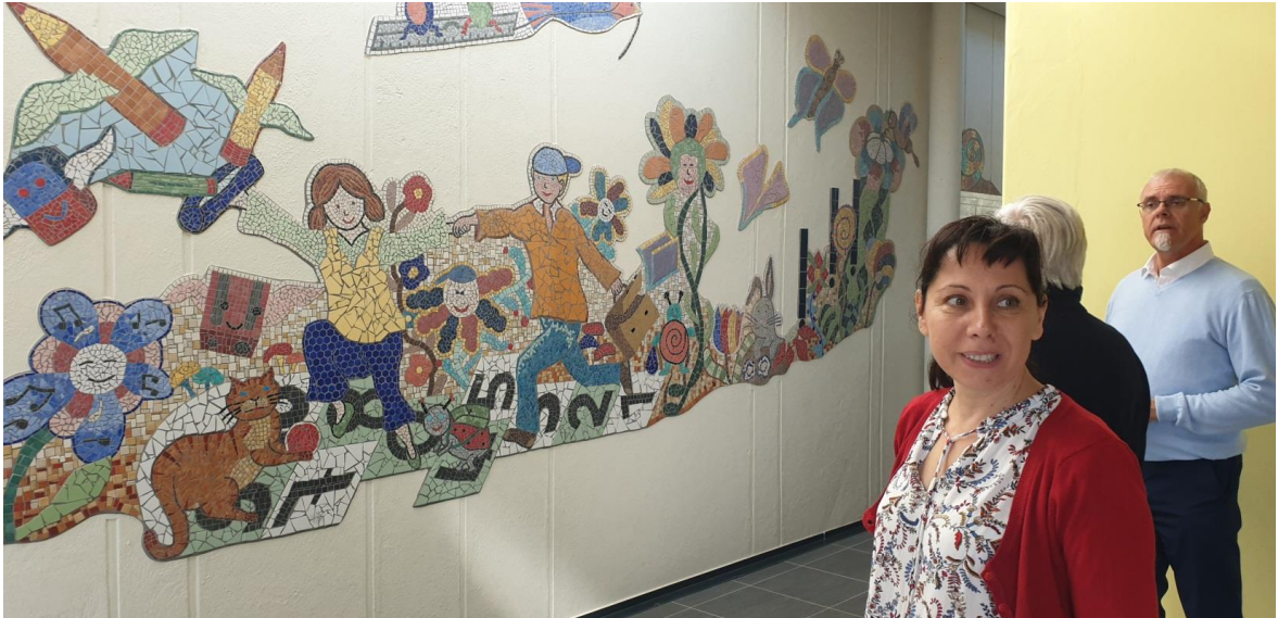
La fresque réalisée en 1997 par les élèves dans le cadre d'un projet pédagogique a été intégralement conservée dans le hall d'entrée de la cage de l'ascenseur.