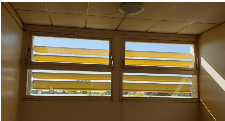
brise-soleil sur les baies vitrées