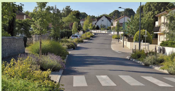
Rue de L'Ermitage