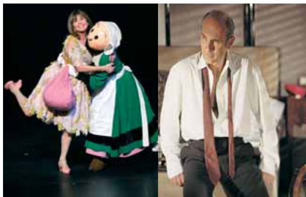
"Les belles sœurs"

Le guide culturel change de format pour améliorer sa lisibilité. Vous y retrouverez, comme chaque année depuis trois ans, l'ensemble de l'offre culturelle de Saint Benoît de septembre à juin, Il sera distribué dans vos boîtes aux lettres fin août 2008.