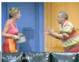
"Chat et souris"

spectacle de danse "Les étoiles de la danse" et plusieurs humoristes montants comme Michaël Gregorio et Virginie Hocq. Rendez-vous en septembre pour l'ouverture de la billetterie Ohé !