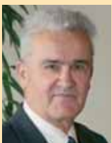
Claude NEUVILLE Délégué à la sécurité civile