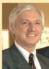
Dominique Clément Maire de Saint-Benoît

Et si je suis aujourd'hui un peu triste, j'ai encore confiance dans notre vieux pays et dans ses institutions qui tiennent bon, contre vents et marées.