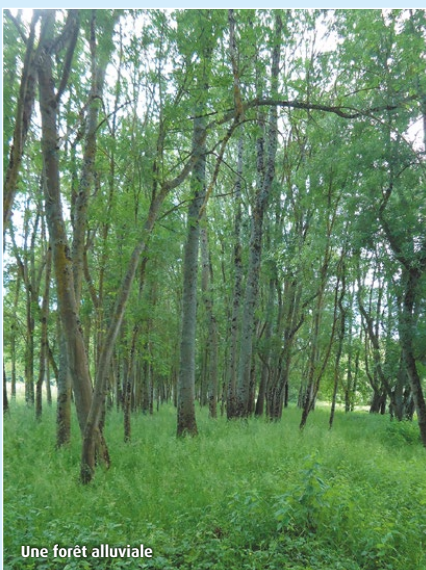
Une forêt alluviale

L'association Vienne-Nature a été choisie par le syndicat du Clain Aval pour réaliser un inventaire des zones humides sur l'ensemble de la commune de Saint-Benoît.