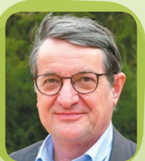
Bernard PETERLONGO Maire de Saint-Benoît