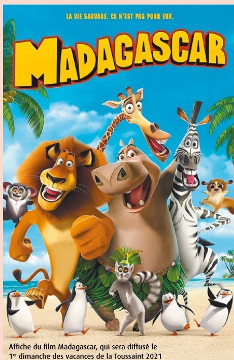
Affiche du film Madagascar, qui sera diffusé le 1 er dimanche des vacances de la Toussaint 2021

N'oubliez pas de retirer vos billets d'entrée sur le site internet de la www.lahune.fr avant chaque séance ! Informations sur Facebook : @lahune86 (ouverture billetterie gratuite 10 jours avant la séance)