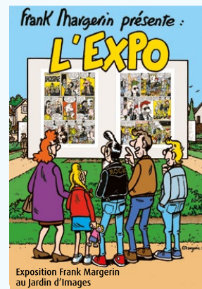
Exposition Frank Margerin au Jardin d'Images

Le mois d'août est rayonnant pour la culture à Saint-Benoît ! De nombreuses expositions vous attendent en Salle Capitulaire, au Dortoir des Moines et au Jardin d'Images. Jusqu'au 29 août, découvrez l'exposition du G6 sous la magnifique charpente du Dortoir des Moines. Vous serez séduits par les clichés (sans thème particulier) présentés par ce fameux groupe de photographes. En salle Capitulaire, du 18 au 29