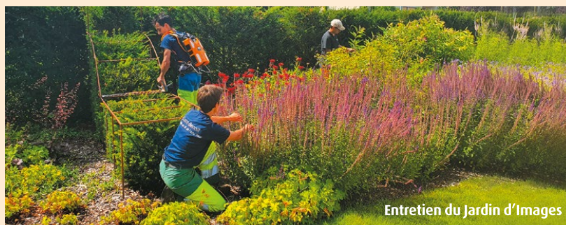
Entretien du Jardin d'Images