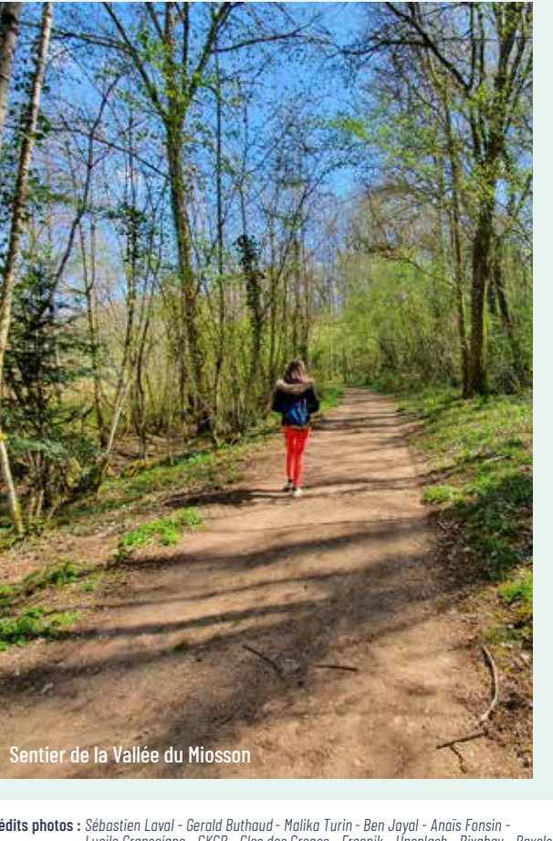
Sentier de la Vallée du Miosson