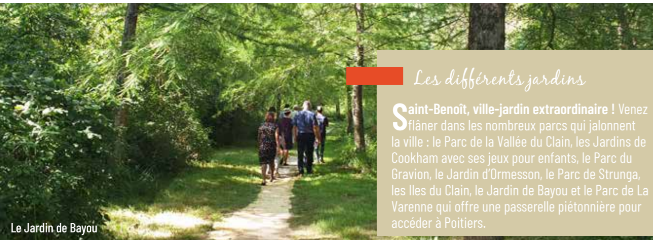
Le Jardin de Bayou

Les différents jardins Saint-Benoît, ville-jardin extraordinaire ! Venez flâner dans les nombreux parcs qui jalonnent la ville : le Parc de la Vallée du Clain, les Jardins de Cookham avec ses jeux pour enfants, le Parc du Gravion, le Jardin d'Ormesson, le Parc de Strunga, les Iles du Clain, le Jardin de Bayou et le Parc de La Varenne qui offre une passerelle piétonnière pour accéder à Poitiers.