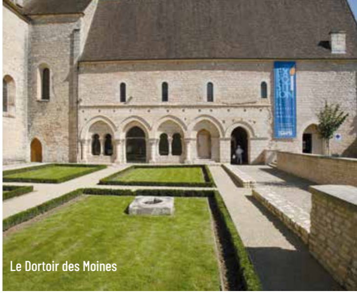
Le Dortoir des Moines

05 49 47 44 53 - tourisme@saintbenoit86.fr