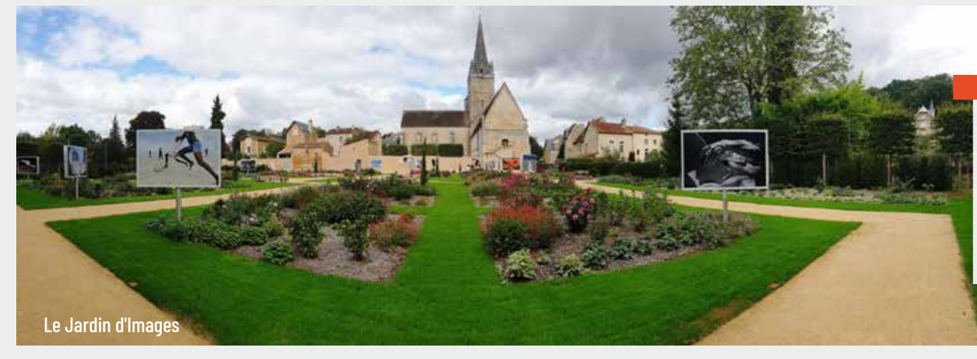
Le Jardin d'Images

Balades à cheval et cours d'équitation Le Clos des Groges est un centre équestre convivial qui vous accueille pendant les vacances scolaires pour des stages d'équitation à partir de 4 ans et pour tous niveaux. C'est également un centre équestre qui donne des cours tout au long de l'année pour tous les niveaux. Les cours d'équitation s'adressent aux plus jeunes cavaliers comme aux adultes. Renseignements et réservation : 06 81 42 56 82 - 05 49 62 53 54 34 Route de Flée, 86280 Saint-Benoît www.centrequestrepoitiers-leclos-desgroges.fr