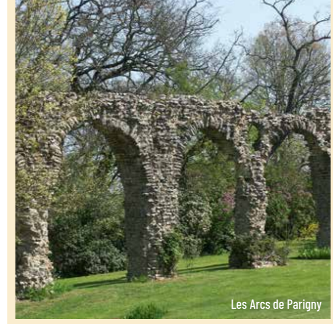
Les Arcs de Parigny

Les Arcs de Parigny Vestiges de l'aqueduc gallo-romain de Basse-Fontaine, datant du 1 er siècle avant Jésus-Christ, ils permettaient d'amener l'eau à Limonum (ancienne appellation de Poitiers) et sont visibles dans la propriété de l'Ermitage.