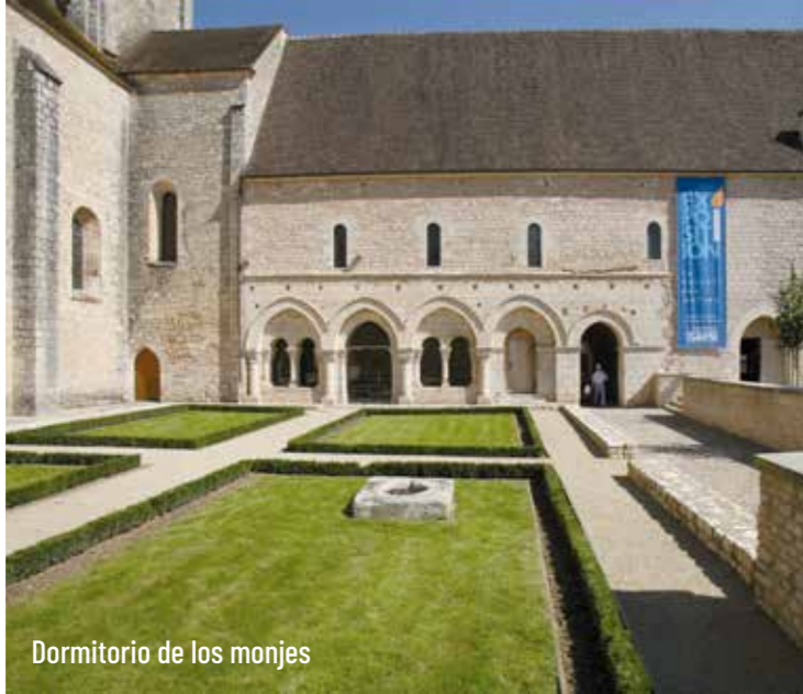
Dormitorio de los monjes

05 48 47 44 53 - tourisme@saintbenoit86.fr