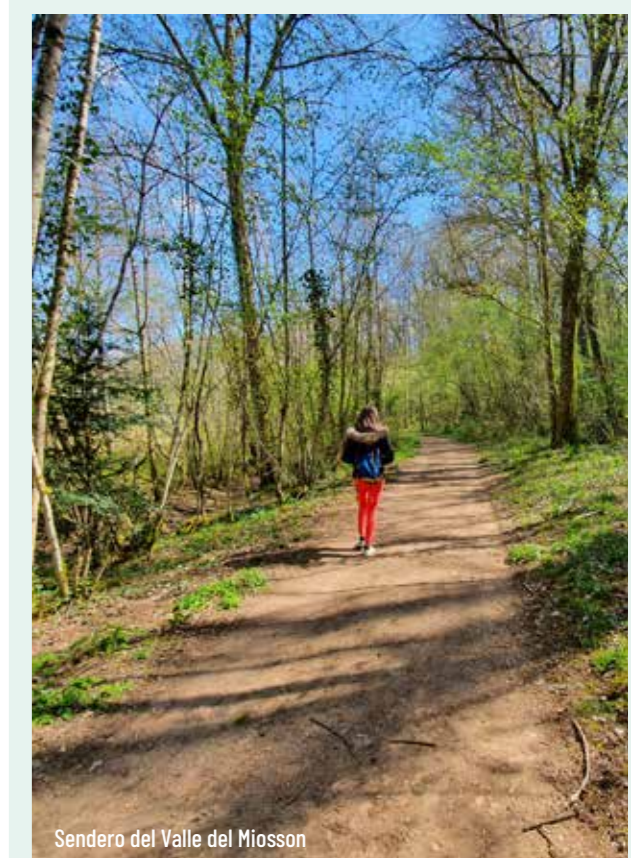
Sendero del Valle del Miosson