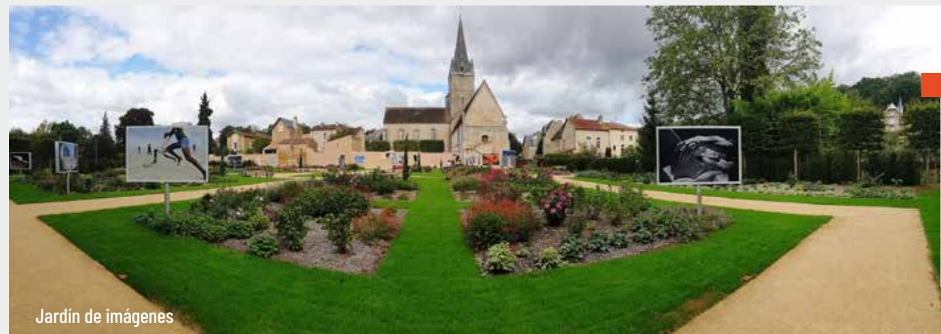
Jardín de imágenes