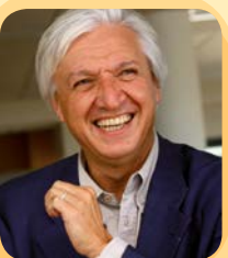
Dominique Clément Maire de Saint-Benoît